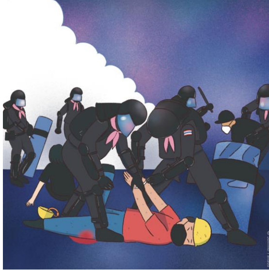
ภาพวาดแสดงให้เห็นเหตุการณ์ตอนที่สายน้ำถูกจับด้วยความรุนแรงโดยเจ้าหน้าที่ตำรวจระหว่างการสลายการชุมนุม / © Amnesty International / Summer Pannadd